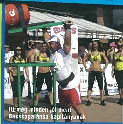
Itt még minden jól ment Bácskapalánka kapitányának

zett, és azt elvégezve, két esztendőn át az utcán ismerkedett a szakmával. Ezután került a terrorelhárító szolgálathoz, majd nyolcéves kommandós múlttal a háta mögött két esztendeje kinevezték Bácskapalánka rendőrkapitányának. Még a kommandós időszakban kedvelte meg a súlyok emelését.